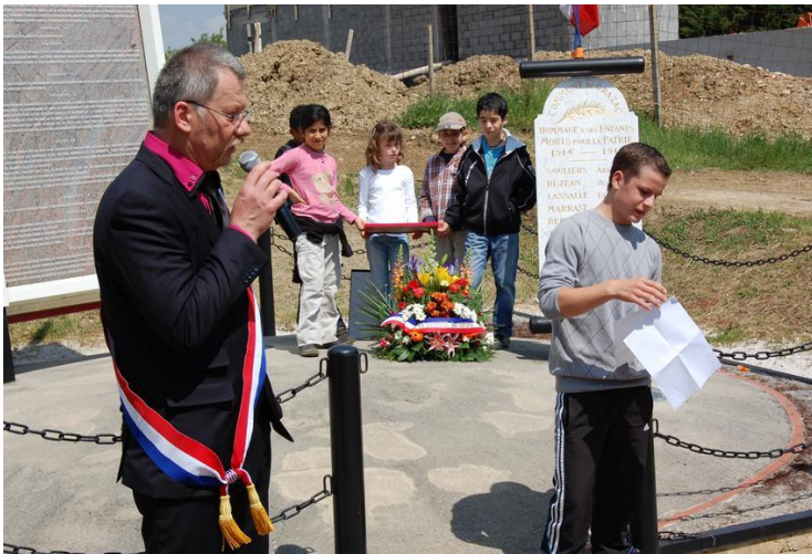
M. le Maire