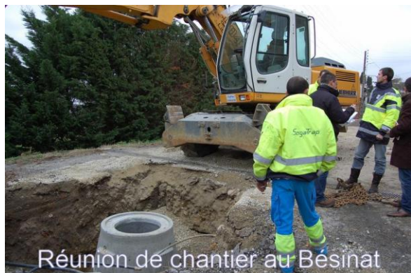
Réunion de chantier au Béginat

Les travaux d'assainissements ont débuté le 17 novembre au Béginat. C'est l'entreprise Sogatrap qui a été retenue pour ces travaux. La conduite principale et les branchements aux particuliers sont réalisés. Ensuite début janvier, les travaux de la petite impasse du Béginat seront effectués. Le réseau d'assainissement après contrôle par les services devrait être opérationnel début février. Si les délais sont respectés, la prochaine tranche prévue sur Grazac, devrait être faite en 2011, Bagnos et le chemin du Château.