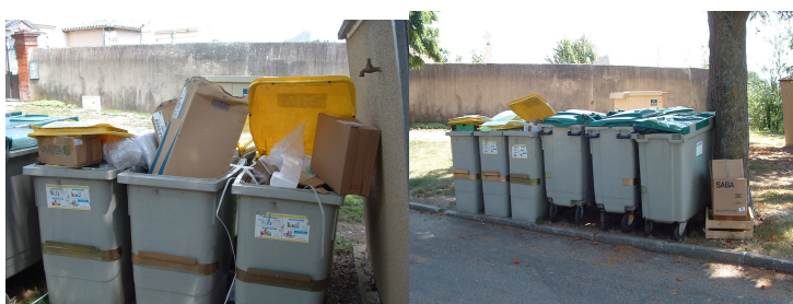
Point de regroupement derrière la Mairie transformé en dépotoir

On peut estimer que globalement les résultats concernant le tri sélectif sont corrects, ils ne demandent qu'à être améliorés, notamment dans les regroupements collectifs, où les encombrants (vieux vélos, chaises de jardin cassées, appareils électroménagers en panne, etc.) et les cartons d'emballages ne doivent pas être déposés dans les conteneurs jaunes, ou autour des points de regroupements. Ceci dit, il semble désormais acquis que certaines personnes transforment ces points en dépotoirs. Le conseil municipal demande à l'ensemble de la population une vigilance continue, afin de minimiser les coûts du tri, en effet, chaque conteneur rejeté coûte cher, et se traduit par une hausse de la taxe des ordures ménagères.