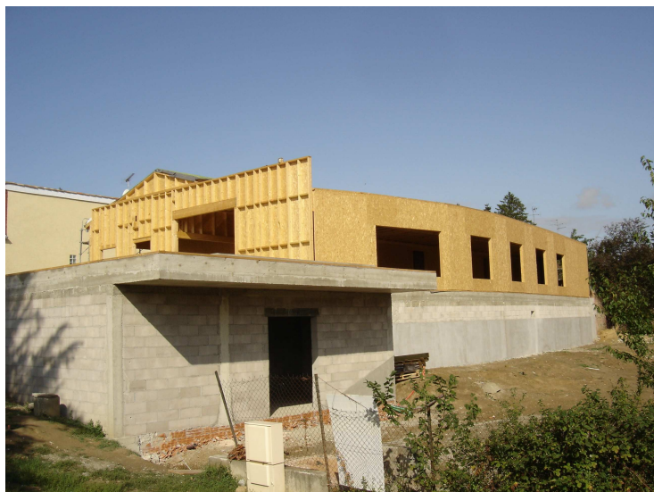
Légende : Il s'agit d'une structure en bois posée sur un socle béton de réalisation classique.

Les travaux de construction de la crèche de Miremont ont débuté au mois de juin 2008. Ce projet, qui avait vu le jour à Miremont en 2005, est aujourd'hui porté et financé par la Communauté de Communes du District de la vallée de l'Ariège. Le terrain a été donné par la commune de Miremont. Le choix de l'emplacement sur le bord de la RD 12 représente pour notre communauté de communes un intérêt géographique important. En effet, cette crèche se situe sur le trajet domicile/travail des communes de Lagrâce-Dieu, Puydaniel, Mauressac, Grazac et Caujac dont les populations actives (pour la plupart) travaillent à Toulouse. De plus, ce choix a été déterminant pour obtenir le soutien financier de la CAF. Il s'agit d'une structure multi accueil de 25 places (crèche/halte-garderie). Cette crèche est la première d'un programme « petite enfance » comprenant le nouveau Centre de Loisirs d'Auterive, qui vient d'ouvrir ses portes, ainsi que la construction de deux autres crèches dont les lieux et genres seront déterminés par les élus du conseil communautaire. L'ouverture de cette crèche est prévue pour le mois de janvier 2009. Dès maintenant les pré inscriptions sont à adresser à la Mairie, qui transmettra au District de la Vallée de l'Ariège.