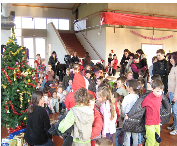
La remise des cadeaux par le père Noël

Cette année encore les enfants de nos communes, ont été gâtés, en témoigne ces images du traditionnel goûter de Noël qui s'est déroulé à la salle polyvalente.