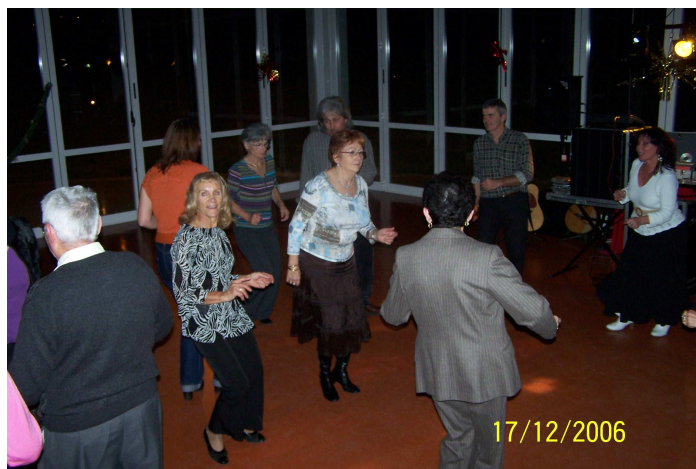
..... même bien après minuit.