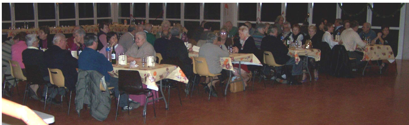
.... Les discussions vont bon train....