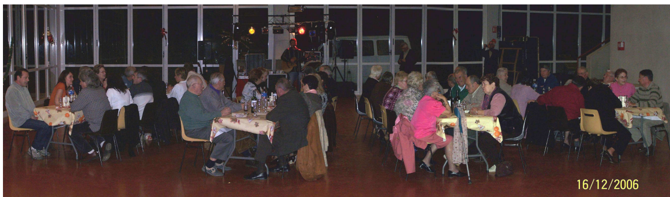
Chacun a trouvé sa place ....

Comme chaque année, le repas offert par la municipalité aux « aînés de notre commune a eu lieu le « samedi 16 décembre 2006 ». Cette soirée a débuté vers 19 h par un apéritif offert à toute la population, suivi à 20h 00 par le traditionnel « repas des aînés » dans la même salle.