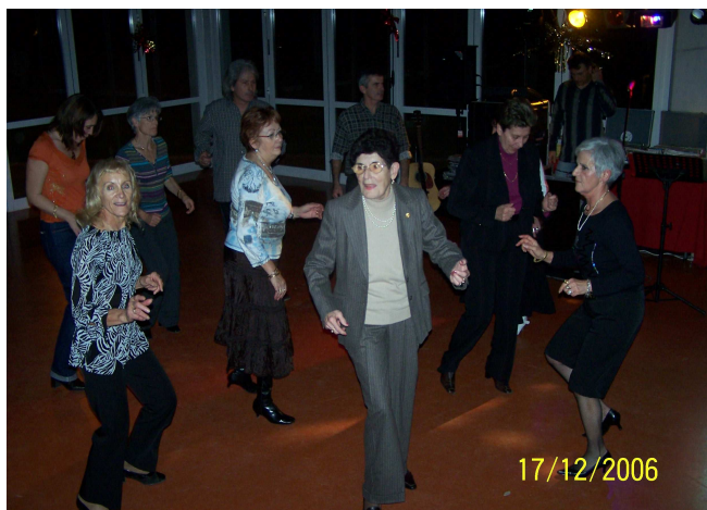
Nos aînés en pleine forme...