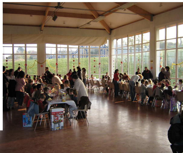
et après ces émotions, le goûter tant attendu